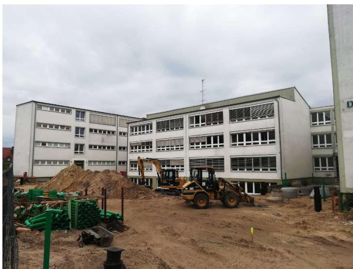
Erweiterung eines Grundschulstandortes