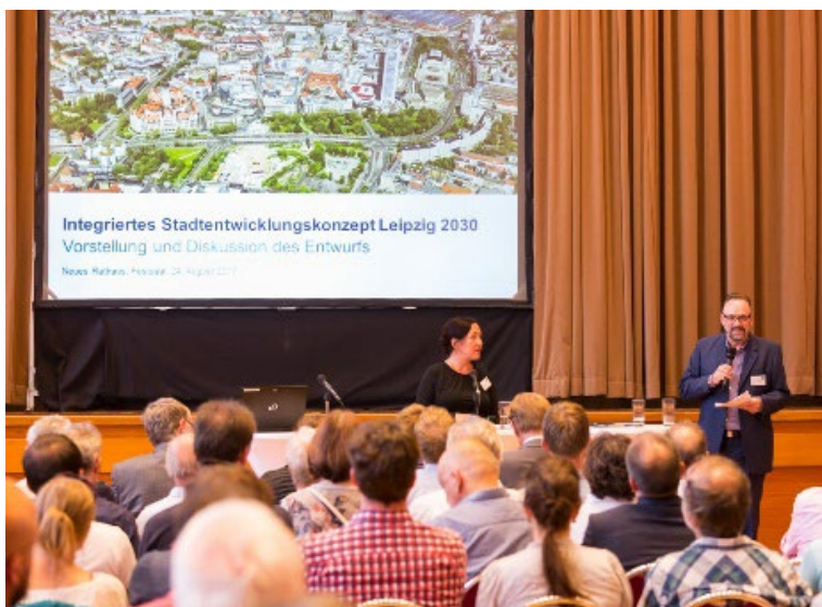
Öffentliche Veranstaltung im INSEK-Prozess