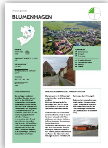
Betrachtung der Ortsteile in eigenen Steckbriefen