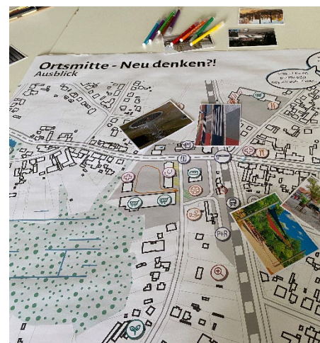
Workshop zur Ortsmitte in Bestensee