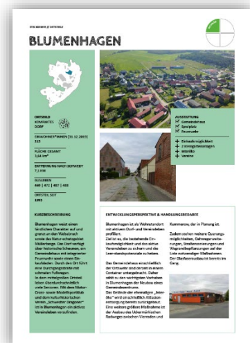
Betrachtung der Ortsteile in eigenen Steckbriefen