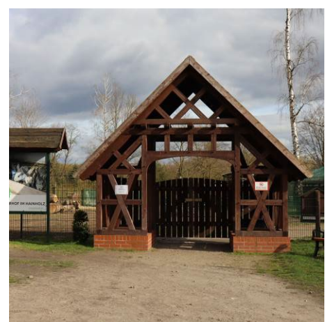
Streicheltierhof als eine der Anker Nutzungen im Hainholz