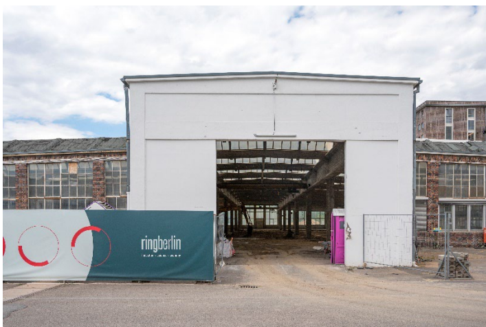
Hier entsteht Europas größter Makerspace